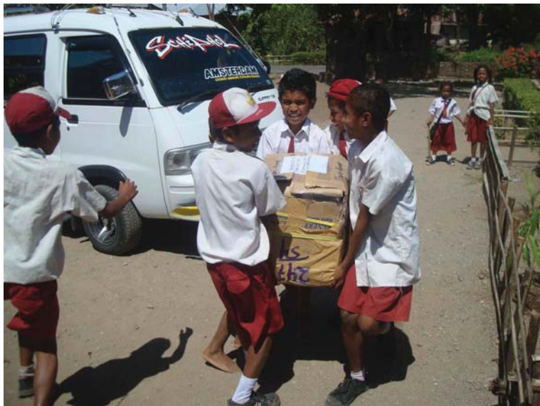
Vijf jongentjes moeten één pakket dragen.