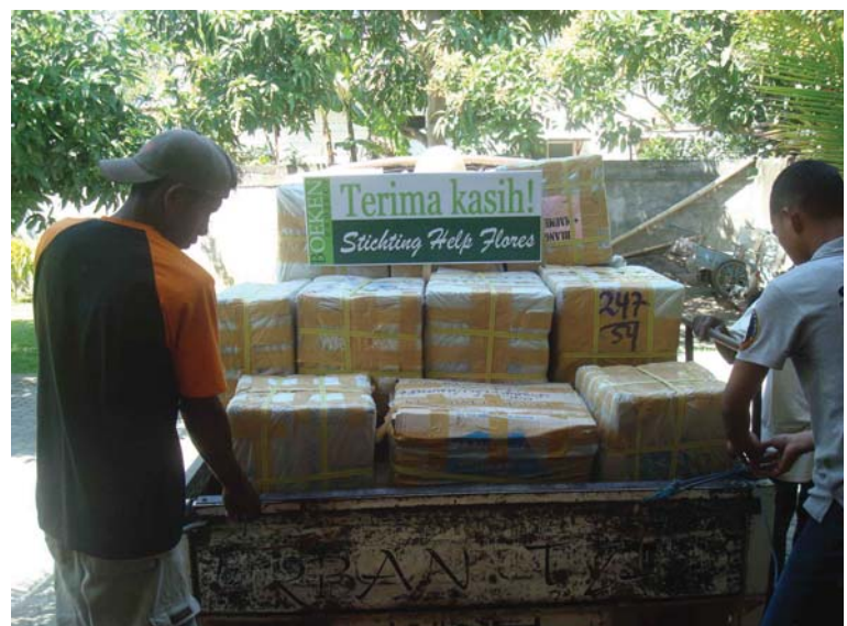
Het vervoer naar de verschillende basisscholen.