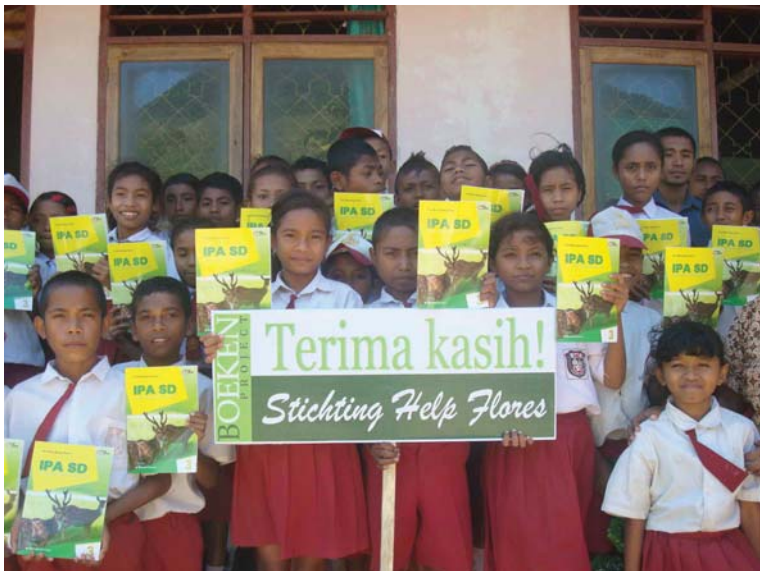
De school in het plaatsje Nebe.