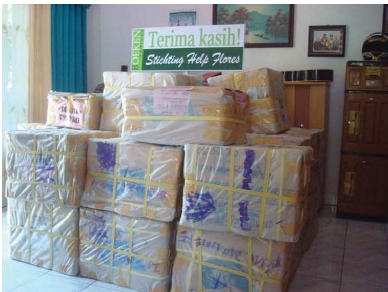
Alle boeken bij Thon thuis, klaar om weg te brengen.

Fantastisch dat dit project gerealiseerd kon worden door u als donateur(s).